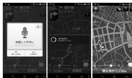
a) 発話表示 b) テキスト表示 c) ルート表示